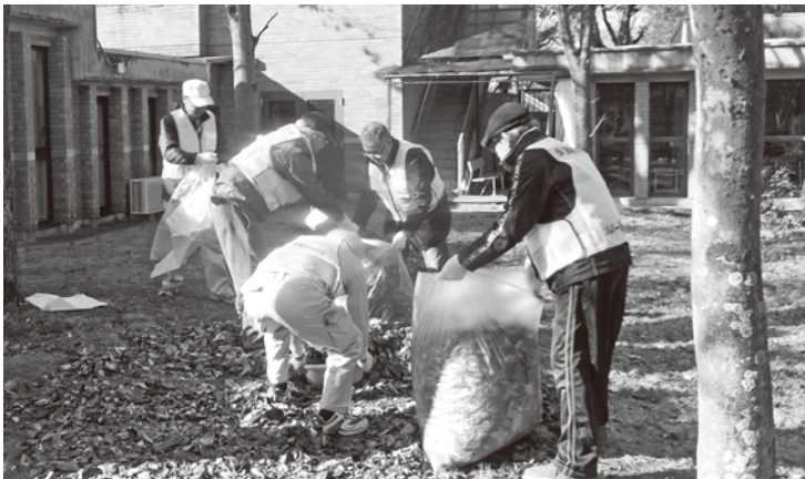
シルバーの事務所周辺の落ち葉掃除する会員の皆さん