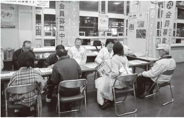
シルバーのブースでは、入会の説明会を実施しました

11月19日(土)・20日(日)の向日市まつりでは、シルバー人材センターのブースにおいて就業風景のパネル展示、仕事の受注や入会受付を行いました。