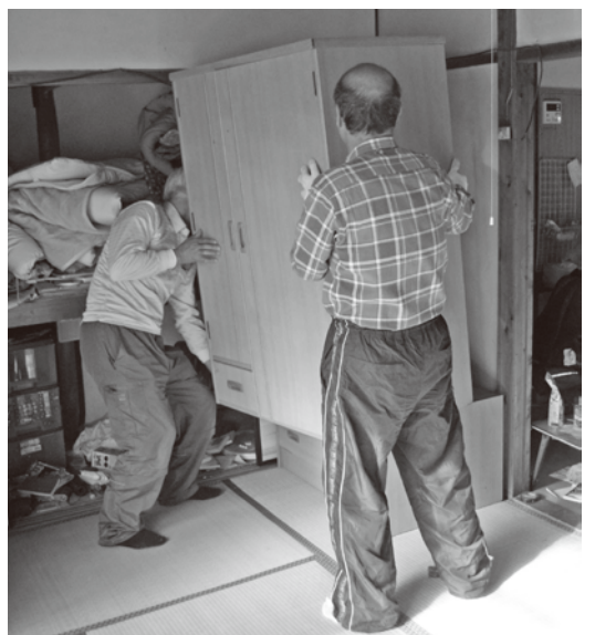
家具など重いものを移動させる応援隊