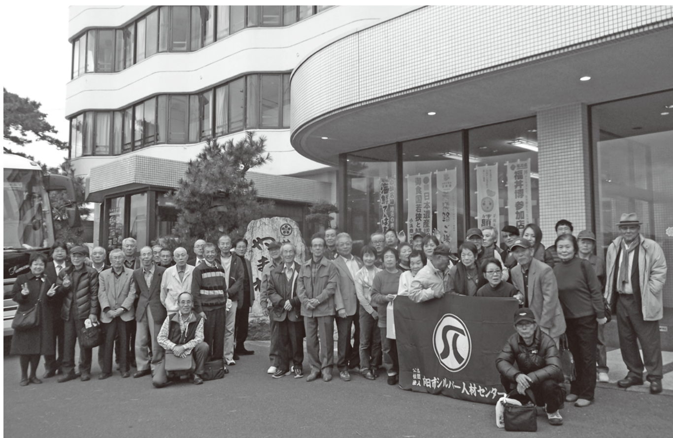
平成28年11月23日 会員親睦研修旅行 小浜温泉・サンホテルやまねにて

第34号 発行 平成29年1月 公益社団法人 向日市シルバー人材センター 〒617-0006 京都府向日市上植野町南開 66-1 TEL：075-932-3987 FAX：075-934-8600 URL：http://www.sjc.ne.jp/muko e-mail：muko@sjc.ne.jp