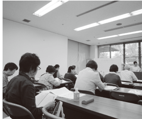
初日の講習では、介護に対する姿勢を学習しました