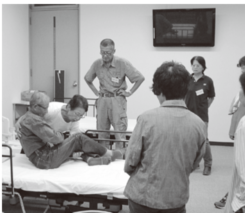
ベッドからの起こし方など基本的な技術を学びました

最後に受講の機会を与えて下さったシルバー人材センター関係者の皆様、講義支援頂いた先生方、関係者に心より感謝申し上げます。本当にありがとうございました。