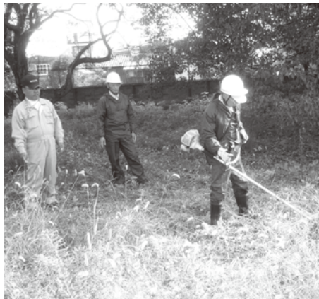
講師が見守る中、実地研修を行う会員