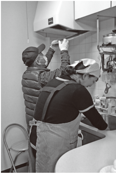
換気扇の掃除を行う応援隊

今年も多くの方から「とてもきれいにしてください、新年を気持ちよく迎えられる」「手の届かない換気扇など、日頃なかなか掃除できない所がかたづけいて助かりました」などの声をいただいております。