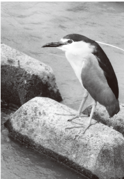
サギにもいろいろあり、これはゴイサギです(小畑川) 寺戸町 夏秋 典行