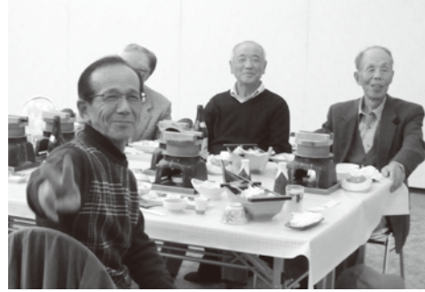
小浜温泉で新鮮な魚介とカラオケを楽しみました

今年度は、11月23日(祝)、会員、役職員の計40名が参加し、福井県小浜市方面へ日帰りバス旅行を楽しみました。