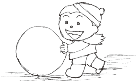
上植野町 谷 英夫