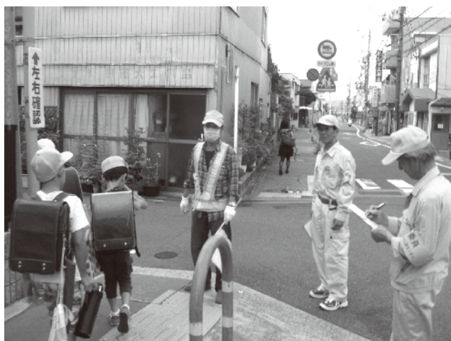
交通指導業務のパトロールを行う委員