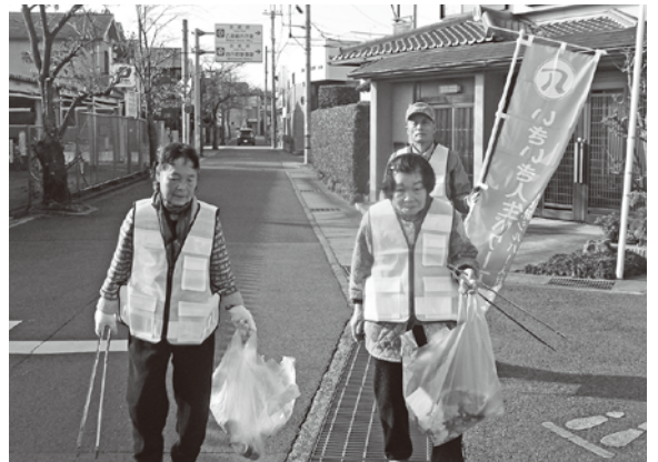
阪急西向日駅周辺のゴミ拾いを実施しました