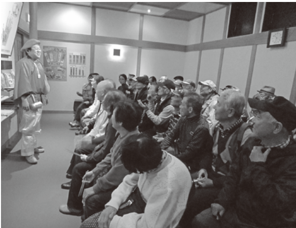
箸匠せいわでは、楽しい「お箸」のお話とお箸づくりを体験

旅行に参加された皆様、ありがとうございます。来年も楽しい旅行を企画します。今回参加できなかった方は、ぜひ来年は参加をお待ちしています。(事務局)