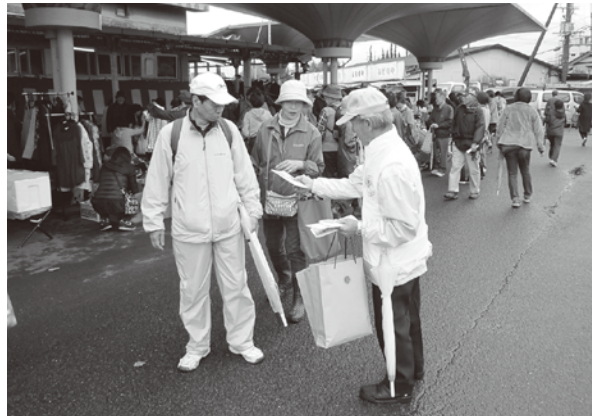
向日市まつり会場でパンフレットを配布しました