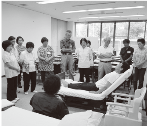
熱心に介護補助技術を学ぶ参加者のみなさん

また、介助を経験して、こんなにも大変なものだと思いませんでしたし、自分が逆の立場になれば非常にありがたいものであるとも思いました。特に、移動させていただくのでこんなにも大変だと思えます。 また講習等あれば参加したいです。