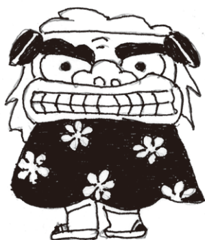
上植野町 谷 英夫