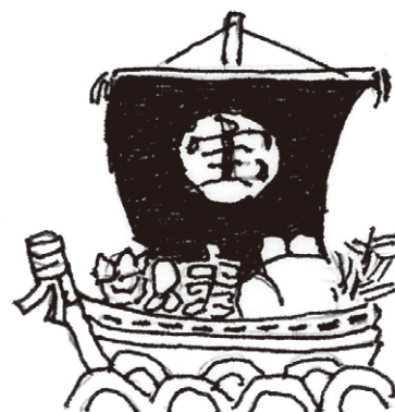
上植野町 谷 英夫