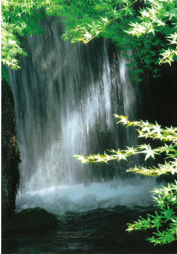
梅小路公園『緑の館』