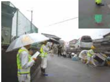
分別収集の現場でパトロールする委員