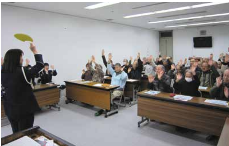
体を動かしながら交通ルールやマナーの再確認をしました。

今回の講習会では、交通安全についての講義をはじめ、DVD鑑賞や反射神経テストを通じて、交通事故から自分を守るために注意すべきことを再認識しました。