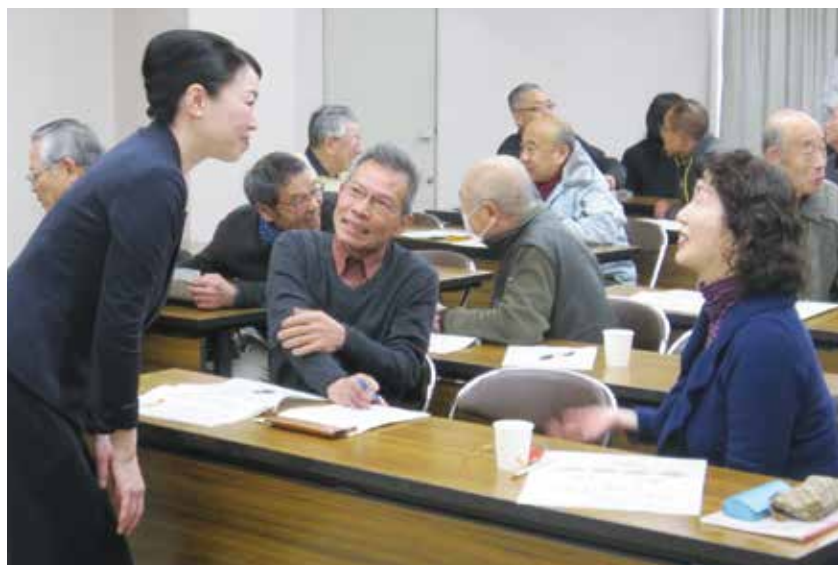
受講者の皆さんも自然と素敵な笑顔がこぼれていました。