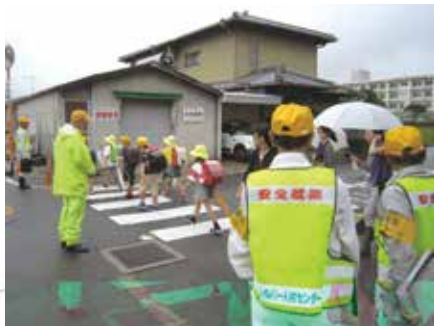
交通指導業務の現場でパトロールを行う委員

また、当センターの事故発生状況に基づき、職種別就業中の問題点について議論を行いました。