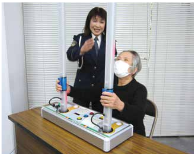
反射神経テストを体験し、反射神経年齢を測定しました。

会員の皆様は、就業場所まで自転車で移動することが多く、そのうちの80%の会員が移動中に危ないと感じたことがあると答えています。