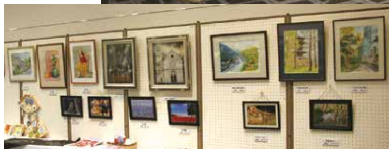
絵画・写真・書道・工作等、たくさんの作品を出展いただきました