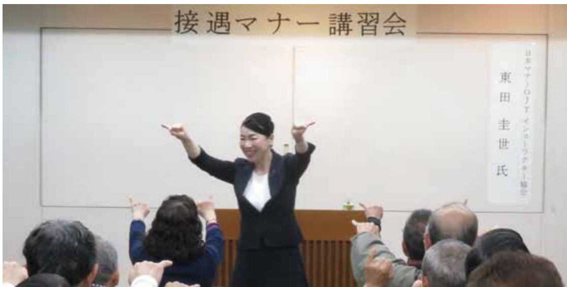
「楽しく学ぶマナー」の演題どおり、分かりやすい楽しい講習でした。