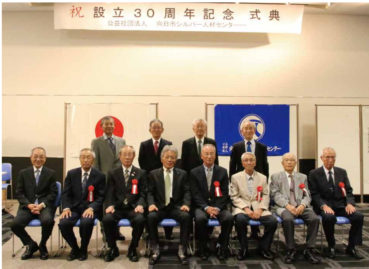
令和元年5月20日 会員表彰(令和元年度定時総会にて)