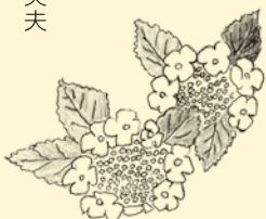
(カッター) 上植野町 谷 英夫