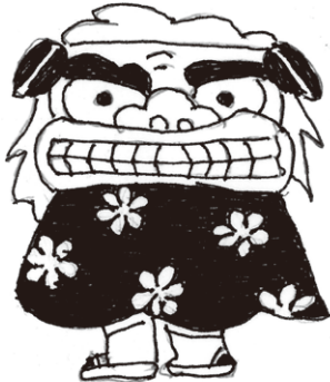
上植野町 谷 英夫