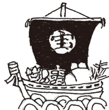
上植野町 谷 英夫